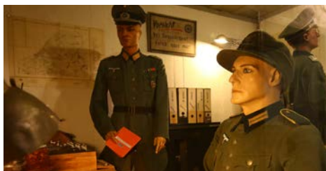
> Musée du 5 juin 1944 "Message Verlain" 4 bis avenue de la Marne

Musée du 5 juin 1944 « Message Verlain » Visite dans le temps et l'histoire, dans un lieu de mémoire comme un bunker allemand d'état-major de la 15 e Armée, avec différents thèmes abordés. Plusieurs salles ont été reconstituées comme à l'époque : locaux techniques (ventilation et électricité), cuisine, sanitaires, chambre/bureau du général, central téléphonique, station d'écoute, etc... Le musée est ouvert le dimanche 19 janvier 2020 de 9h à 18h, ainsi que les dimanches 2 et 16 février 2020 aux mêmes heures. Durée de la visite : environ 1h30. Les visites sont guidées mais le visiteur peut faire la visite seul.